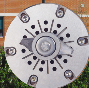
Couteau et plaque à mouvement indirectif 7013