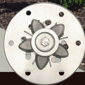
Couteau et plaque à mouvement réversible 7011