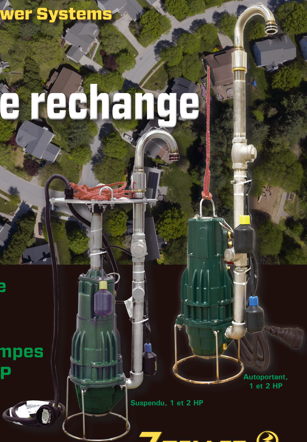
Suspendu, 1 et 2 HP

LPS autoportante et suspendue ensembles de recharge des pompes broyeuses 1 - 2 HP