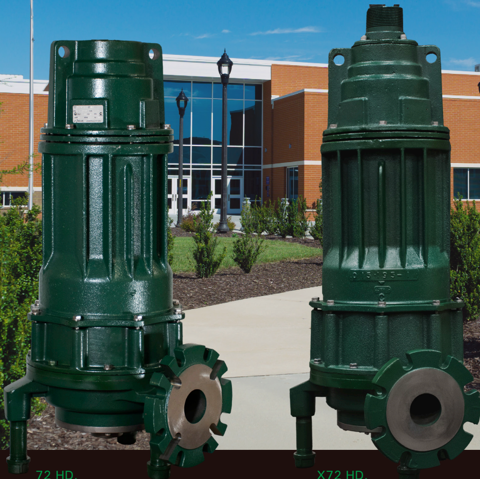
72 HD, Évacuation 4 po